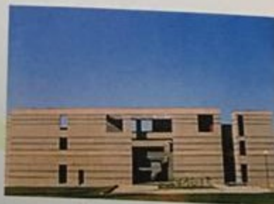
ICICI Knowledge Park