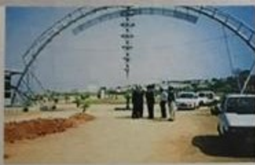
Genome Bio-Tech Park