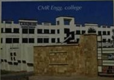
CMR Engrg. college

NH-7 జాతీయ రహదారిలో మెట్రోపాలికి అతి సమీపంలో హైవేనుండి కేవలం 1.25 కిలోమీటర్ల దూరంలో 54 ఎకరాల సువిశాల విస్తీర్ణంలో 40 మిలియన్లు 33 అడుగుల తారురోడ్లతో భూగర్భ (UNDER GROUND) లైన్లతో, వాటర్ సదుపాయాలు మిలియన్లు UNDER GROUND విలక్షితమే, 1.25 లక్షల రీటర్న్ల 1.25 కిలోమీటర్ల ట్యాంకులు, ప్లాన్సిల్, ప్రైవేట్ లైన్లతో వాస్తవ ప్రకారం అన్ని సదుపాయంతో వివరణాత్మకమునకు అనువైనదిగా రూపుదిద్దుతుంటున్న 'ది మెట్రోపాలి'.