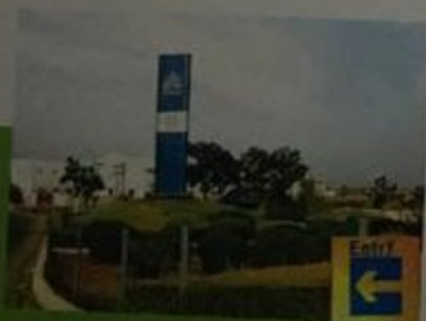
Satyam Tech Park

Water Aplenty, Unlike areas like Kukatpally and Dilsukhnagar, which are always crowded and the roads sprinkled with potholes, Medchal road is a hassle-free stretch that facilitates less travel time and smooth driving.