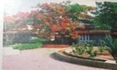
Satyam Public School

Complete with all amenities like Paved BT roads, Electricity, Street Lighting, Underground Cabling, Water, Drainage, Parks, Fencing, Water Harvesting Pits and Excellent Connectivity, "The Majestic" is truly the place to be!